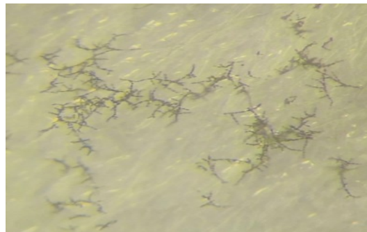
Альтернариоз ( Alternaria spp. )