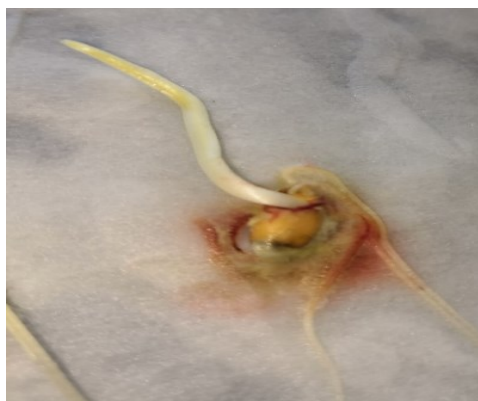
Фузариоз пшеницы ( Fusarium spp. )