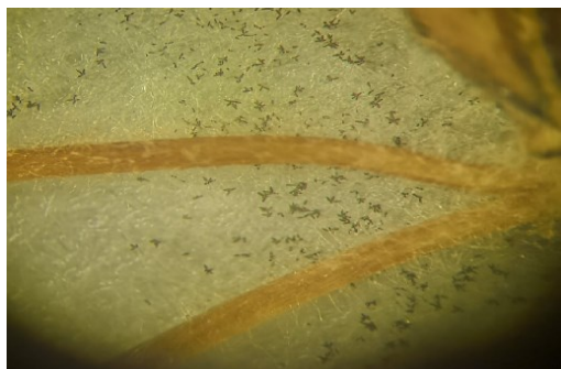
Гельминтоспориоз ячменя ( Drechslera teres )